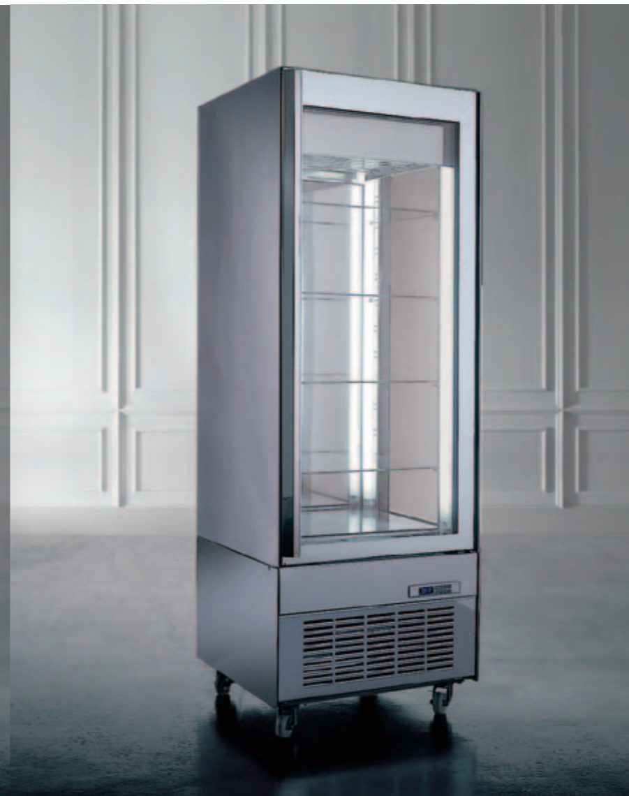
Visibilità fronte-retro Back and front visibility