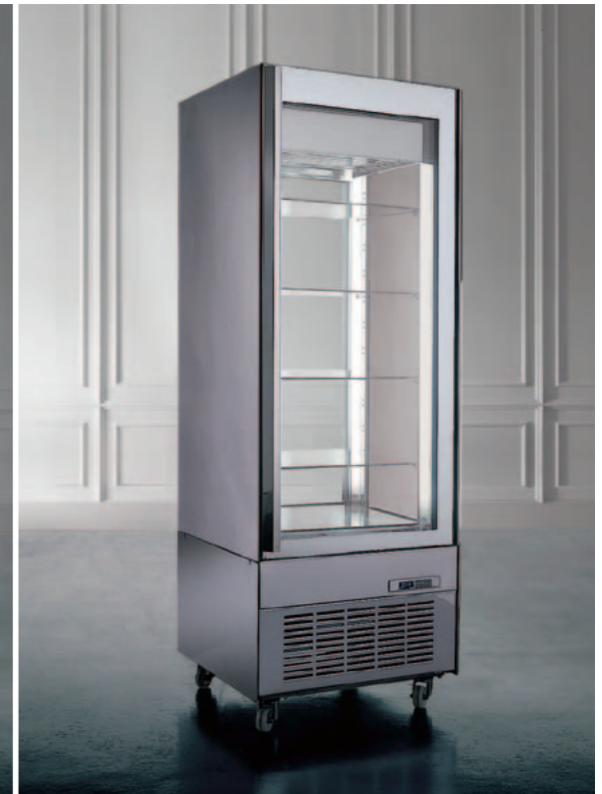
Visibilità frontale Front visibility

La vetrina Cosmo è disponibile in quattro versioni, progettate per consentire esposizione e visibilità perfette per ogni esigenza.