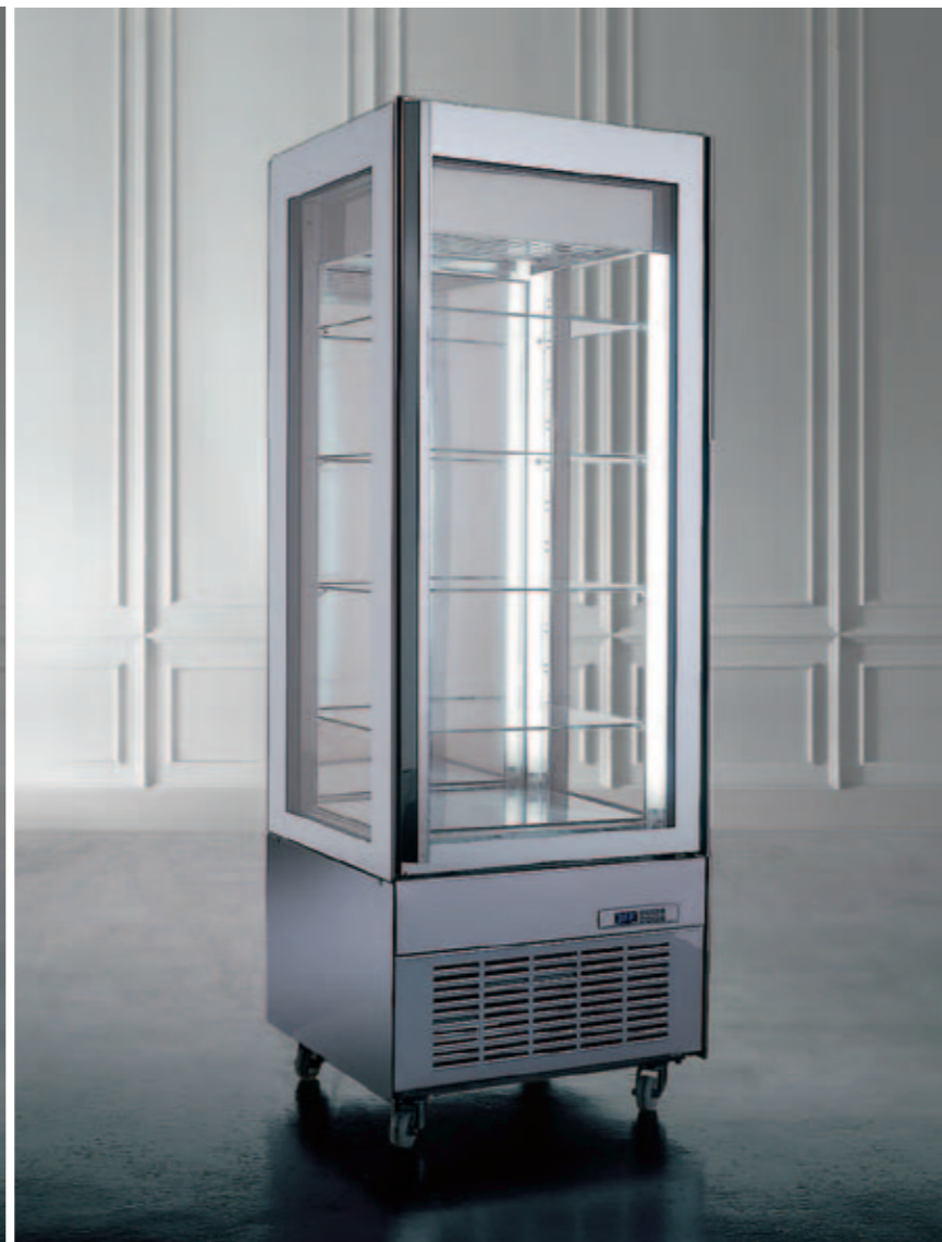
Visibilità su tre lati Visibility over three sides